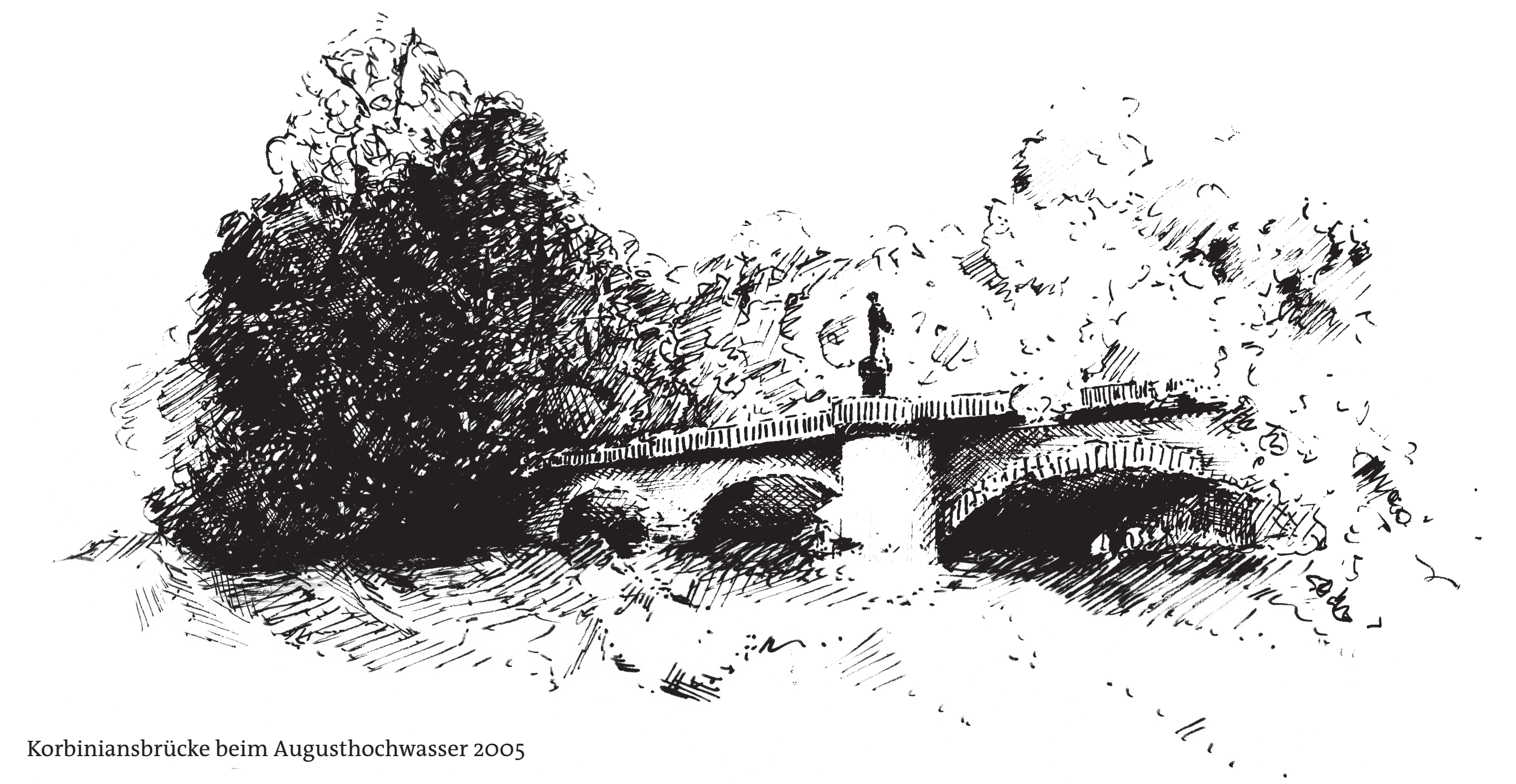
Korbiniansbrücke beim Augushochwasser 2005

Damit die ungefähr 100 Jahre alten Deiche an der Isar auch weiterhin vor Hochwasser schützen, werden sie nach und nach saniert. Bereits 2013 wurde die Sanierung der Freisinger Deiche abgeschlossen.